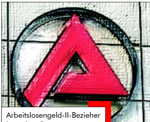
Arbeitslosengeld-II-Bezieher brauchen Betreuung.